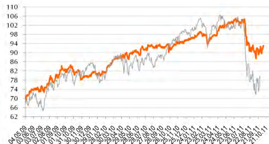
Entwicklung des NDACinvest im Vergleich mit dem DAX

Gemeinsam von den chancenreichsten Aktien profitieren!