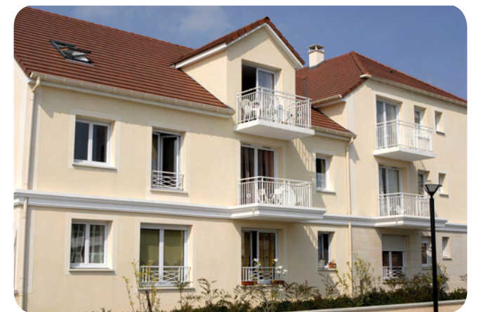
Der NDAC hat Ende Juni 2011 Anteile für 29,60 Euro an der Börse gekauft.

Immobilienfonds Premium Management Immobilien ist ein Dachfonds für Offene Immobilienfonds, dessen Rücknahme in 2010 ausgesetzt werden musste, nach dem die Kombination aus einer große Welle von Anteilsrückgaben und umfangreiche Positionen an Offenen Immobilienfonds, die ihrerseits die Anteilsrücknahme ausgesetzt hatten, diesen Schritt erforderlich machte. Im August 2011 wurde schließlich angekündigt, dass der Dachfonds aufgelöst werden soll.